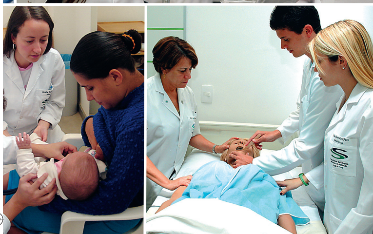
Imagem são os cursos da Suprema que podem oferecer garantia de sucesso profissional