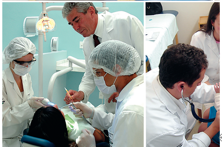
OPÇÕES DA SAÚDE | Fisioterapia, farmácia, odontologia, medicina e enfermagem