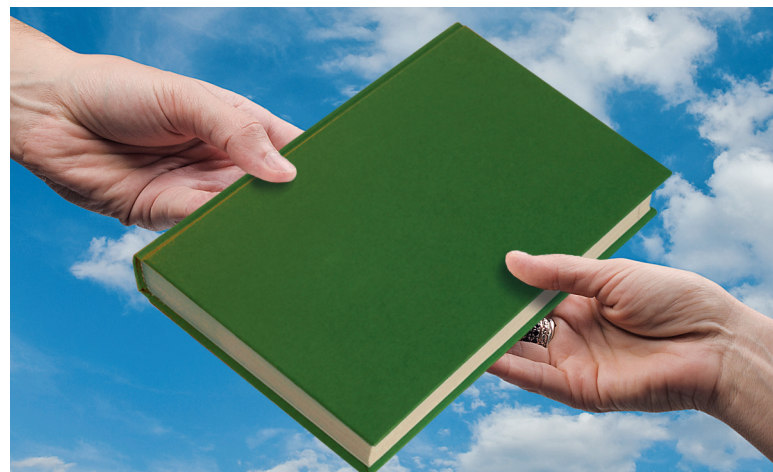
[INTERCÂMBIO] Ações conjuntas enriquecem o ensino e divulgam a arte do Teatrando na Saúde

A Suprema arrecadou 1.380 kg de alimentos (foto) não perecíveis, entregues ao Instituto Bruno Vianna e ao Instituto Jesus, que assistem crianças carentes. A doação foi dos próprios alunos da faculdade, em troca de ingressos para a festa da Calourada, no Privilège. A Calourada deste ano incluiu ainda uma visita ao Instituto Jesus, onde os estudantes desenvolveram atividades esportivas e de lazer com as crianças.