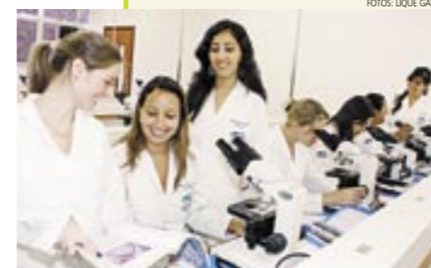
|ATLAS| Ideia simples e criativa

Coordenação editorial Jorge Montessi e Newton Ferreira Núcleo de Comunicação e Marketing Vivian Castro e Cintia Brugiolo Jornalista responsável Marcelo Abrão Projeto gráfico, editorial e produção Support Comunicação