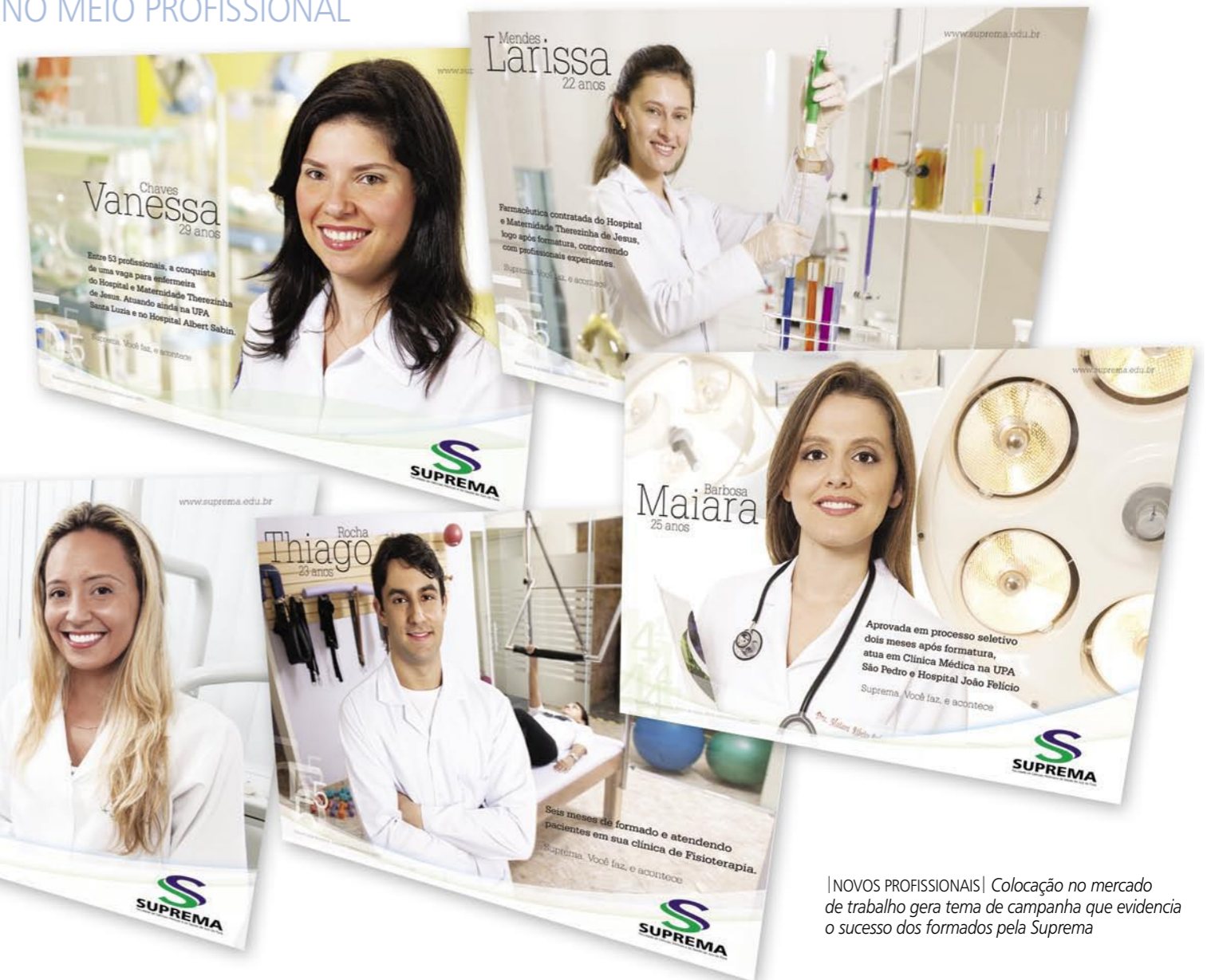
[NOVOS PROFISSIONAIS] Colocação no mercado de trabalho gera tema de campanha que evidencia o sucesso dos formados pela Suprema