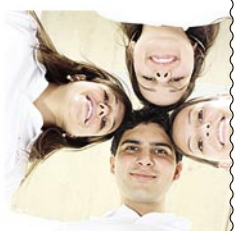
Estudantes criam a primeira empresa júnior de Odontologia em faculdade particular