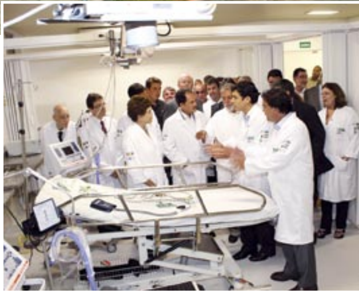
| INAUGURAÇÃO | Presidente Lula descerra placa de inauguração da UPA, no bairro Santa Luzia, e visita as dependências, acompanhado de demais autoridades e pela diretoria da Suprema, gestora do hospital que irá gerenciar a nova Unidade