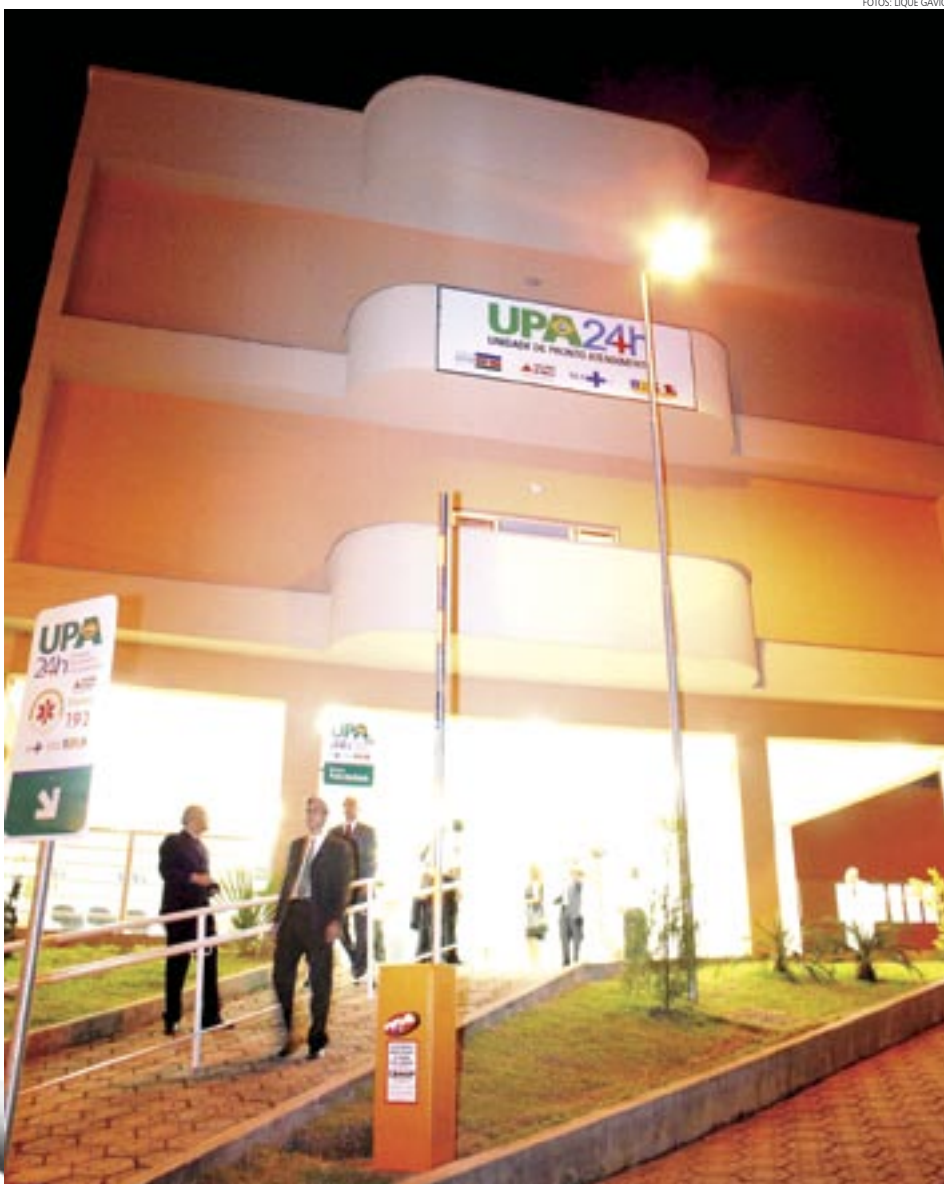
| SANTA LUZIA | Unidade de Pronto Atendimento terá gestão do HMTJ, o hospital universitário da Suprema