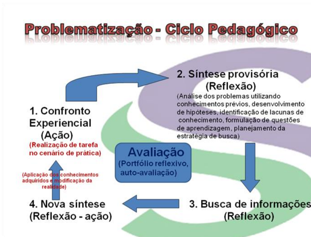
FIGURA 3: Problematização - Ciclo Pedagógico