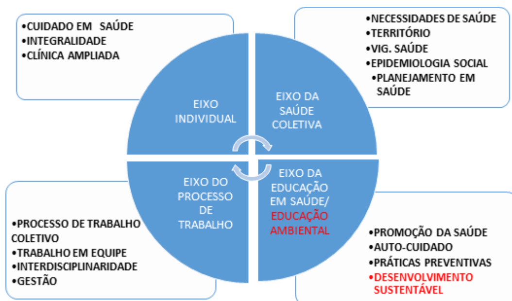
FIGURA 2: Referenciais da Unidade Programa Integrador

É através da compreensão e da representação da amplitude deste conceito que se trabalhará os demais referenciais que subsidiarão os eixos do PI.