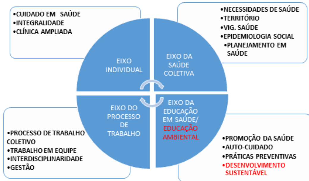
FIGURA 2: Referenciais da Unidade Programa Integrador

É através da compreensão e da representação da amplitude deste conceito que se trabalhará os demais referenciais que subsidiarão os eixos do PI.